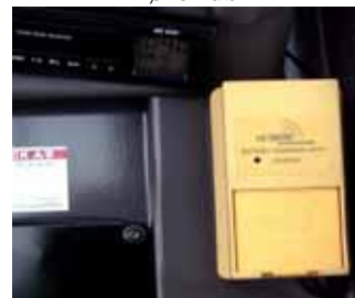
Placering af batterilader i førehus

Overtrædelse af disse punkter kan være forbundet med livsfare.