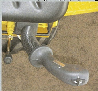
Frem/bak i joystick