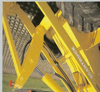
Parallelføring af redskaber