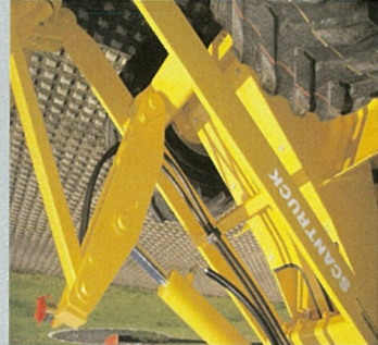
Parallelføring af redskaber