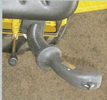
Frem/bakfunktion i joystick