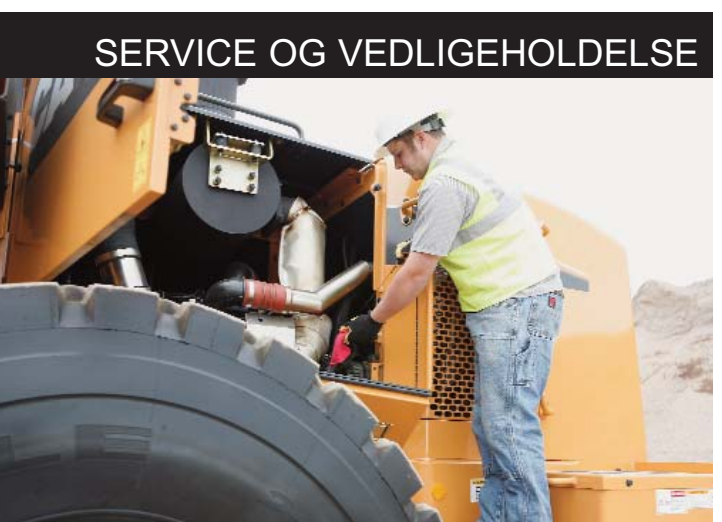
SERVICE OG VEDLIGEHOLDELSE

Bag på maskinen falder den helstøbt motor-hjelm nedad, hvilket giver et fortræffeligt udsyn bag føreren. Kølersystemet er monteret bagest, med let adgang for rengøring.