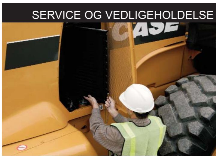
SERVICE OG VEDLIGEHOLDELSE

Bag på maskinen falder den helstøbt motor-hjelm nedad, hvilket giver et fortræffeligt udsyn bag føreren. Kølersystemet er monteret bagerst, med let adgang for rengøring.