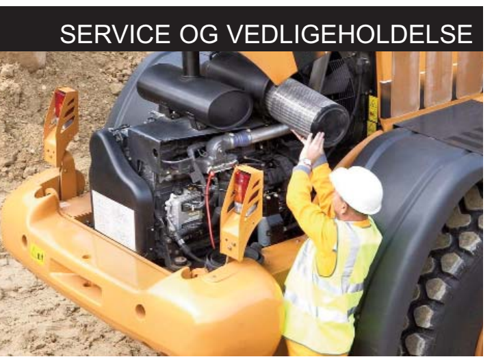
SERVICE OG VEDLIGEHOLDELSE

Bag på maskinen falder den helstøbt motor-hjelm nedad, hvilket giver et fortræffeligt udsyn bag føreren. Kølersystemet tager luft ind bag førerhuset.