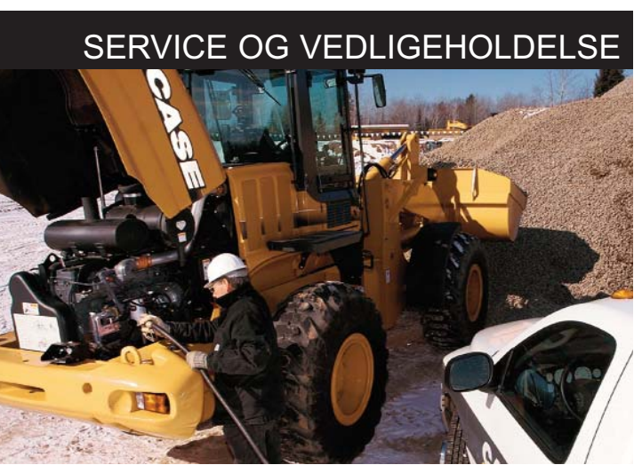
SERVICE OG VEDLIGEHOLDELSE

Centermonteret kølesystem med hydraulisk ventilator. Systemet fås med reversibel ventilator (ekstra udstyr). Dette reducerer den daglige vedligeholdelse og sikrer en god køling.