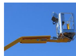
Fly jib (option)