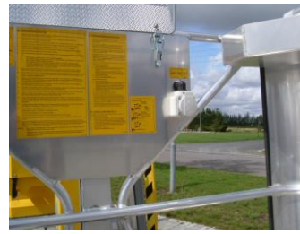
230 V udtag i kurv